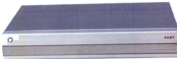
Schlichte Eleganz: die verspiegelte Front verbirgt nur drei LEDs, ein Außen-Display fehlt.

Auch die Fernbedienung ist eine Sparausführung – während am großen TV-Server ein modifizierter Loewe-Geber Dienst tut, finden PVR-100-Nutzer ein schlichteres Modell im Karton. Immerhin sind die Tasten praxisgerecht arrangiert, das Handling geht angesichts des Preises in Ordnung. Wer später einen Schritt in Richtung Luxusklasse machen möchte, kann die aufwändigere Fernbedienung für 39 Euro separat kaufen.