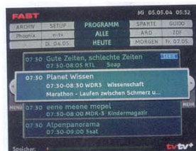
Durchdachtes Bedienkonzept: Programmierung und Verwaltung der Aufnahmen macht das übersichtliche Menü zum Kinderspiel.