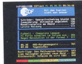
Dreingabe: Interessant für Besitzer von Projektoren und LCD/Plasma-Monitoren ist der im PVR 100 integrierte Videotext-Decoder.