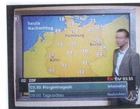
Zappen de luxe: Nach jedem Senderwechsel verrät der EPG die aktuelle und die folgende Sendung sowie den bereits abgelaufenen Teil.