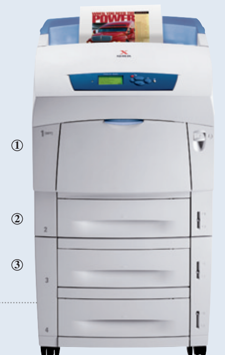
Phaser 6250DX Farbdrucker

Geld sparende und schnelle, automatische Duplexoption für den 2-seitigen Druck (Standard bei DP-, DT- und DX-Konfiguration).